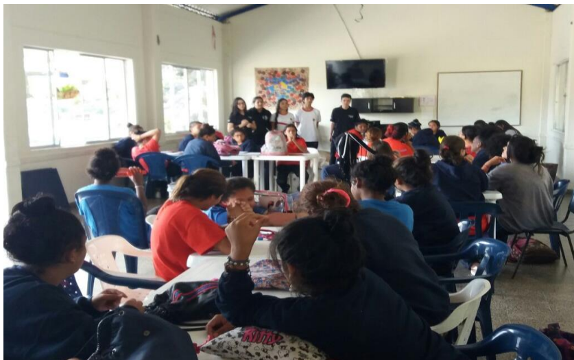
HOGARES CLARET MIRAFLORES