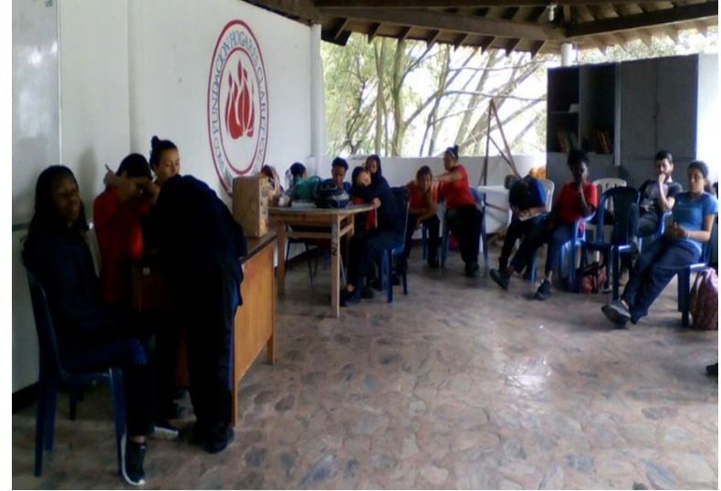
HOGARES CLARET LA LIBERTAD