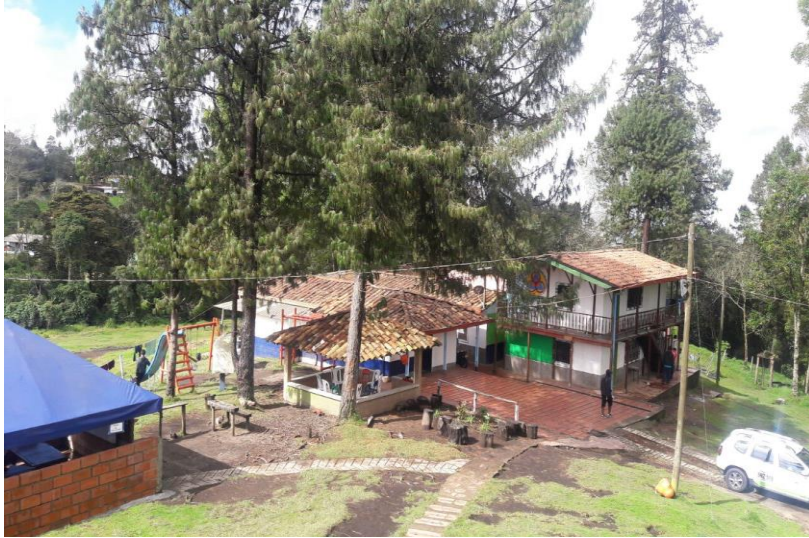
HOGARES CLARET MIRAFLORES